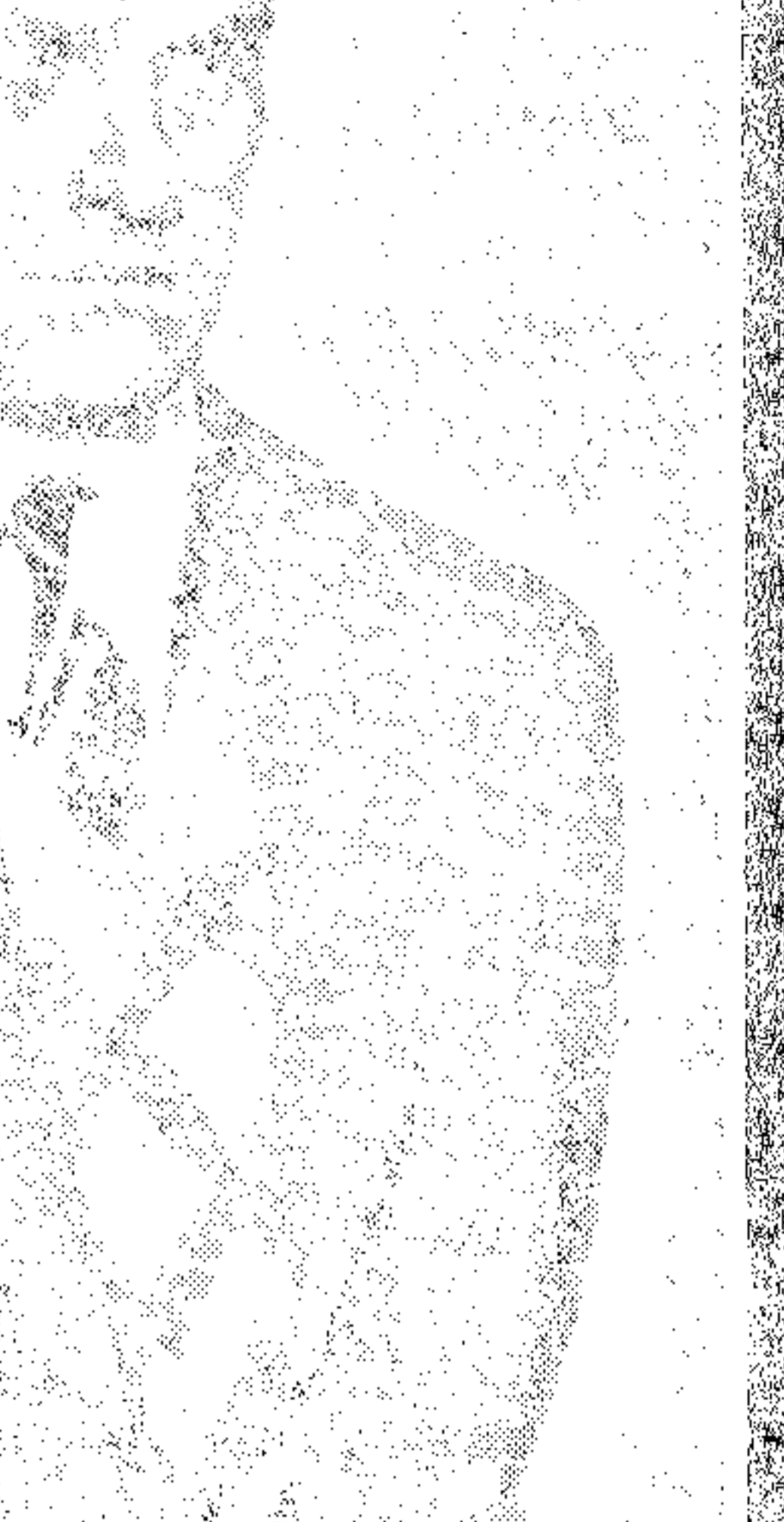
В. В. МАЯКОВСКИЙ