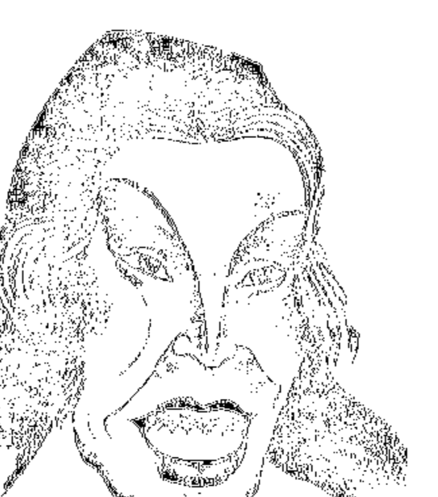
Шошн З. Водяниловича

«Вот «Фигуральный об истопнике... «Итоги «Воспоминаний»».